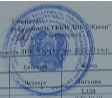
"Сауриан" БЖК 2022-2023 оқу жылы сабақ кестесі / Расписание кружка ДНБ "Сауриан" на 2022-23 уч.г.