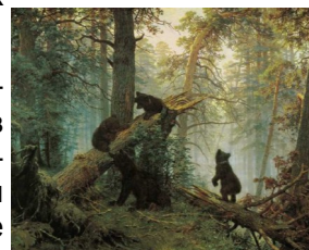
Запомни, как обязан вести себя в лесу воспитанный человек