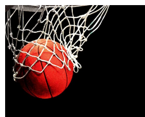
Турнир по баскетболу проходил в школе—интернат №2.

ла - интернат №2. За третье место ребята играли с 14 школой. В этой встрече победила наша школа. До этой победы нам не удавался баскетбол. И вот наконец - то долго-