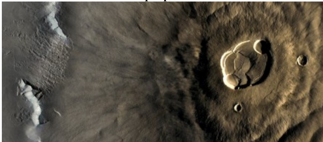
9-сурет – Альпинизм

Өзге ғаламшарлардағы таулы жерлеріне бару – болашақта ең бір қызықты спорт түріне айналады дейді білгіштер. Күн жүйесіндегі өзге де планеталарда біздің ғаламшарымыздағы тауларға қарағанда биік таулы (9-сурет) жыныстары бар. Мәселен Шолпан ғаламшарында Иштар деп аталатын тау біздегі Тибет тауларынан екі есе биік. Ал оның ортасында 11 мың метр биіктікте жанартау бар екен. Ал күн жүйесіндегі ғаламшарларының ішінде биік тауымен Марс қана мақтана алады екен. Олимп жанартауының биіктігі 24 мың метр. Екінші орында Вест шыңы.