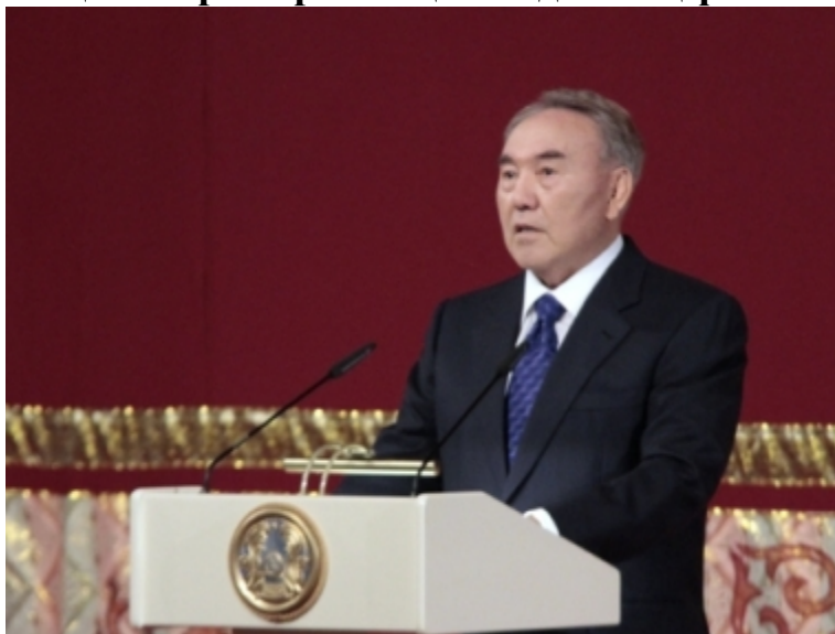
2-сурет – Елбасы

4-жаттығу. Тыңдалым. Мәтіндегі айтылған ойға назар аударып, өз көзқарасыңызды Елбасының пікірімен салыстырып айтыңыздар.