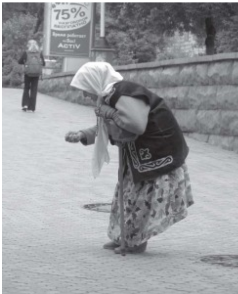
1-сурет – Кедей

Осы аптада « Forbes Kazakhstan » журналы еліміздегі байлығы асқан елу азаматтың тізімін жариялады. Дүниесі миллионды артқа тастап, миллиардтармен өлшенген қалталылар қатарына қазақтың кешегі қарадомалақтарының да қосылғанына қуандық.