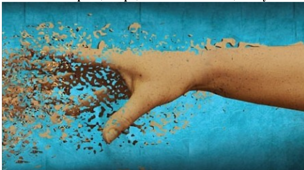
6-сурет – Телепортация

2009 жылы Мэриленд университетінің кванттық физика мамандары бір атомды бір метр қашықтыққа телепортациялады. Осы нәтижелі зерттеу әлі де дамып, бүкіл әлем ғалымдарының назарына ілігуде. Егер қандай да бір затты екінші бір жерге телепортациялау (6-сурет) сәтті дамып жатса, бұл арқылы кәдуілгі тығылыспақ ойынының заманауи түрін дамытуға болады екен. Геокэшинг деп аталатын ойын қазірдің өзінде-ақ ойналып жүр. Бұл ойын – GPS -құрылғы арқылы тығылыспақ ойнау болып табылады.