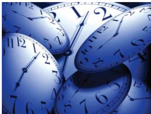
10-сурет – Сағат

Исламда уақытты дұрыс әрі пайдалы да сауапты істермен өткізудің маңыздылығы өте зор. Өйткені уақыт – Алла тағаланың адамға берген сыйы. Бұл мақалада баршамыз білсек те, көп жағдайда мән бере бермейтін уақыттың қадірі мен құндылығы жайлы сөз етеміз. Егер адам уақытының бір бөлігін өткізсе, өмірінің де бір бөлігі кеткені. Кім уақытын ойын-сауыққа арнаса, өмірі де содан аса алмағаны. Сол себепті жалпы мұсылман кісі, әсіресе, жастар уақытын пайдалы нәрсеге арнап, жемісін көруі тиіс.