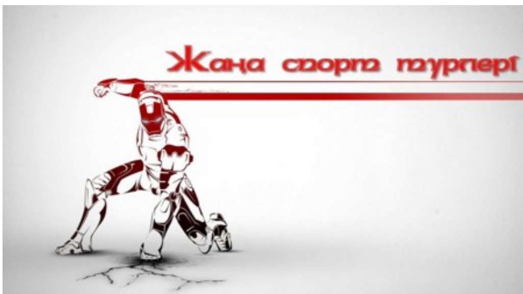
4-сурет—жаңа спорт түрлері

Ғылымның дамуы барысында жаңа мүмкіндіктер ашыла түседі. Джетпак, телепорт немесе киборгизация сияқты сөздердің өзі бізге еміс-еміс естілетін болды. Бір қызығы, жаңадан шығып жатқан технологиялардың барлығы да көріпкелдердің болжамы мен жазушылардың кітаптарында «нұсқаулық» ретінде болған. Massaget.kz адамзаттың болашақта айналысатын (4-сурет) спорттың жаңа түрлерін ұсынады.