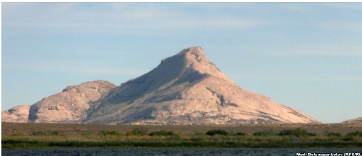
3-сурет – Бектау ата тауы

Қазақстан билігі өткен жылы елге 3,4 миллион шетелдік азамат келгенін, 5 миллионға жуық Қазақстан азаматы шетелге саяхаттап барып қайтқанын айтып отыр. Бірақ мамандар туризм саласында шешімін күткен мәселелер аз еместігін айтады.