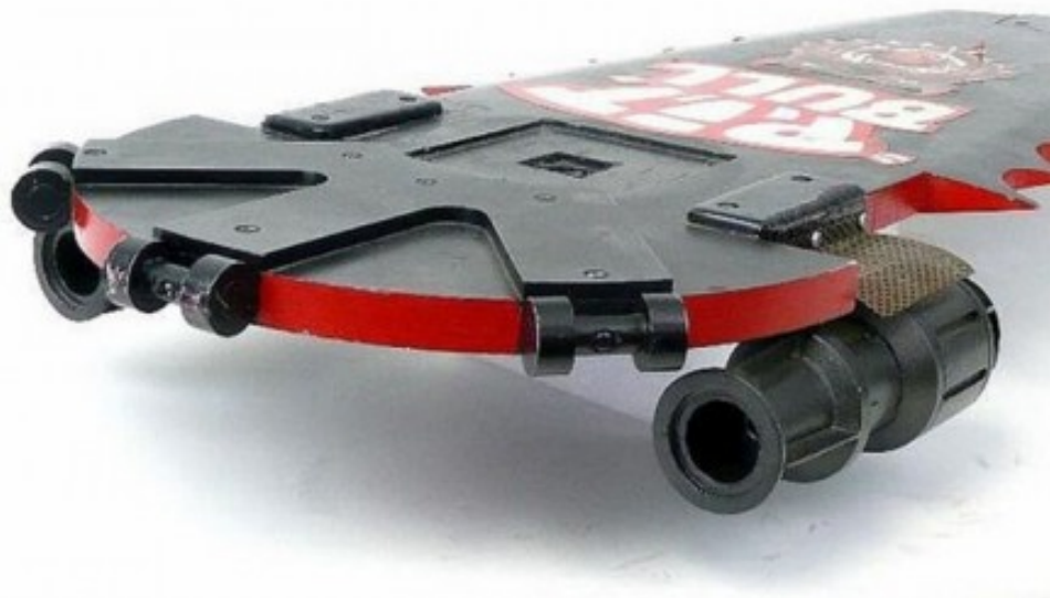
8-сурет – Ховерборд

Ховерборд (8-сурет) – дөңгелегінің орнына «антигравитатор» орнатылған ұшатын скейтборд. Әзірге бұл құрылғы жер бетінен 7 сантиметр биіктікте ғана ұша алады. Бұл аппараттың айқын протатипі «Назад в будущее» фильмінде бар. Фильмде 2015 жылы болатын оқиға суреттелген. Қиялдап көрсек, келер жылы біз осындай ховербордтармен сабаққа я жұмысқа да бара аламыз немесе таулы алқаптарды ұшып саяхаттай аламыз. Ғалымдар да бұл аппаратты дамыту үстінде екен.