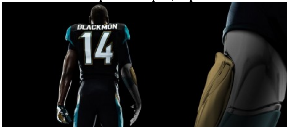
7-сурет – Киборг