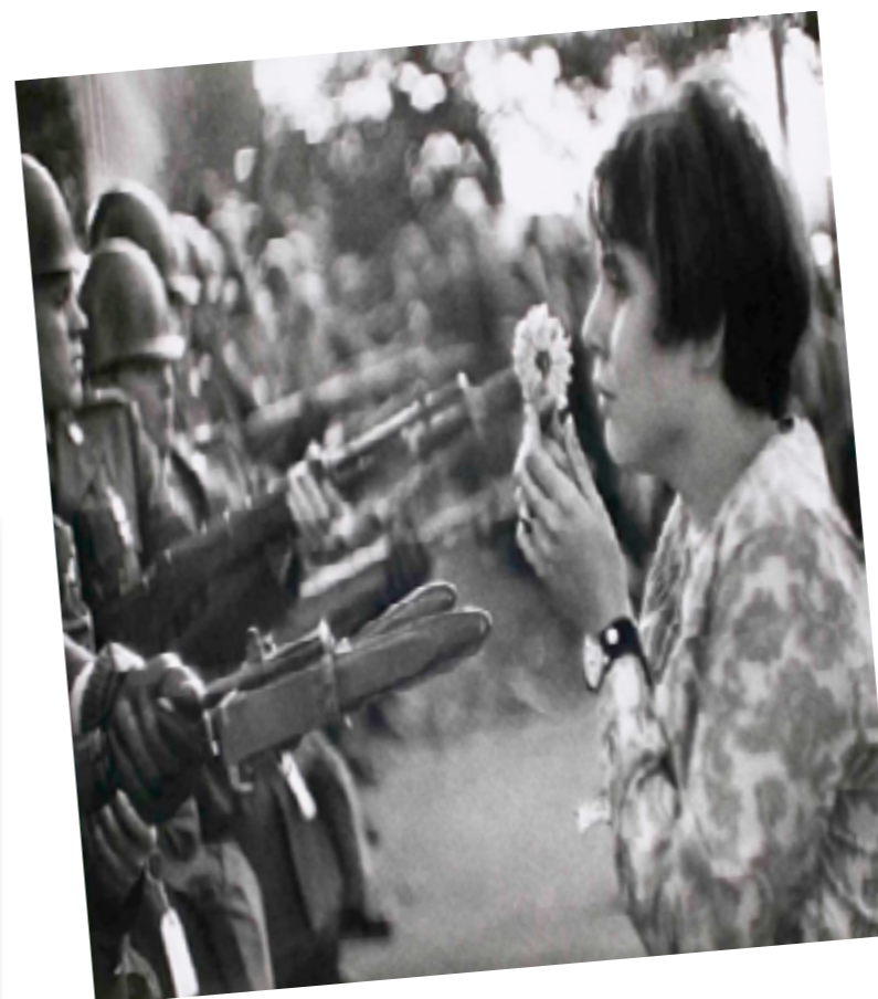
© Курашева Айдана, 10 К сынып оқушысы

Әрбір таңым арайлы, Бақыт нұры тарайды. Халқым менің әрқашан Бейбітшілікті қалайды.