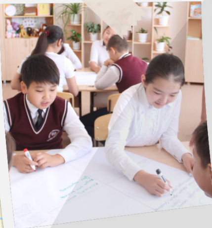
«Все согласны? Мы вместе должны принять решение»