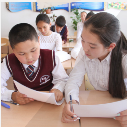
«Давай сначала прочитаем критерии, чтобы узнать, что от нас требуется»