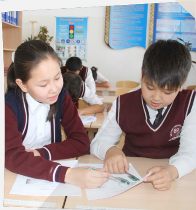
«Мне трудно выполнить задание по данному критерию»

Вот так мы учимся каждый день. Мы работаем в парах, группах, индивидуально. Мы часто оцениваем свою работу и работу своих одноклассников, а учитель нам помогает.