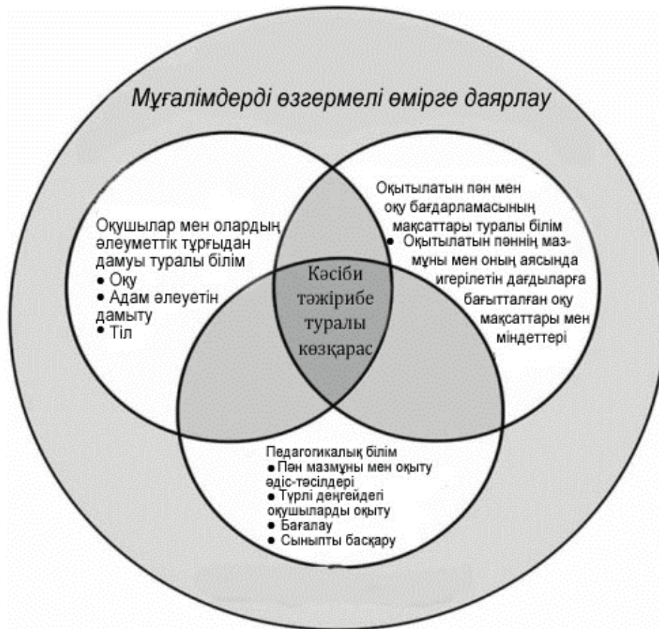
1-сурет. Мұғалімнің түйінді білімдері

Диаграммада әр мұғалім үшін маңызды болып табылатын білім, білік және дағдылардың негізгі 3 саласы көрсетілген. Оларға: